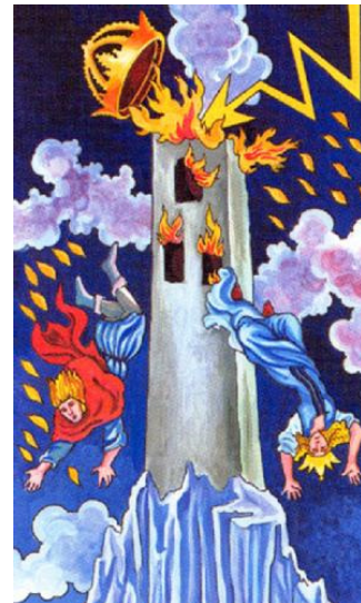
La Torre Fulminada